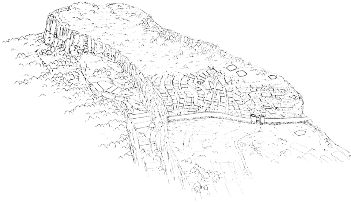
Restitució gràfica hipotètica de l' oppidum iber -segles III-II aC.- (Dibuix: F. Riart)